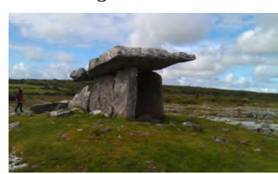
Poul nabrone Dolmen - 2015