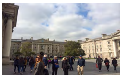
Dublin University College – 2015