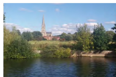
Salisbury - 2016