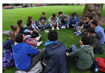
York - 2015