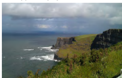
Cliffs of Moher – 2015