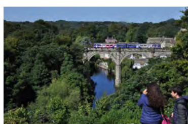
Knaresborough – 2015