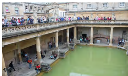
Bath - 2016