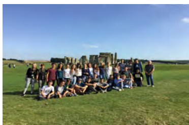
Stonehenge - 2016