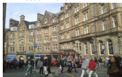
Edimburgo - 2015